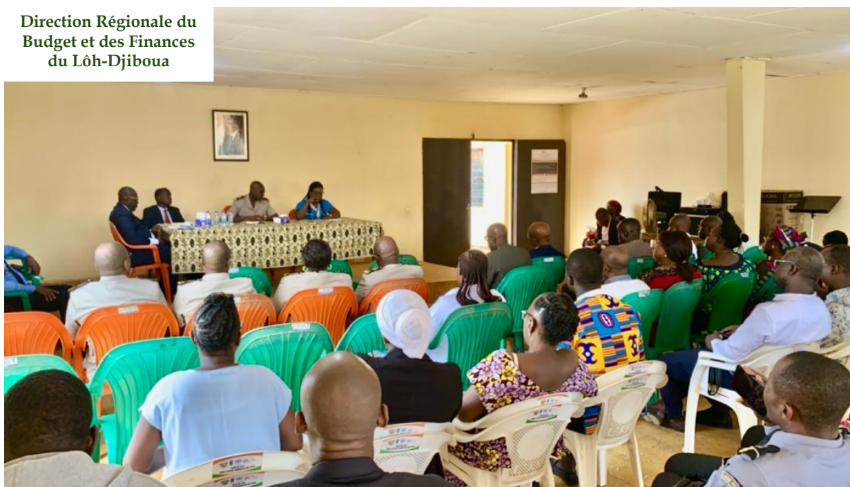
Salle de réunion de la préfecture de LAKOTA

Direction Régionale du Budget et des Finances du Lôh-Djiboua