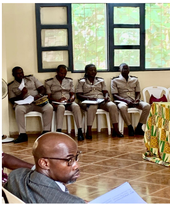
Rentrée Budgétaire 2024 à GUITRY Les membres du corps préfectoral du département de GUITRY.