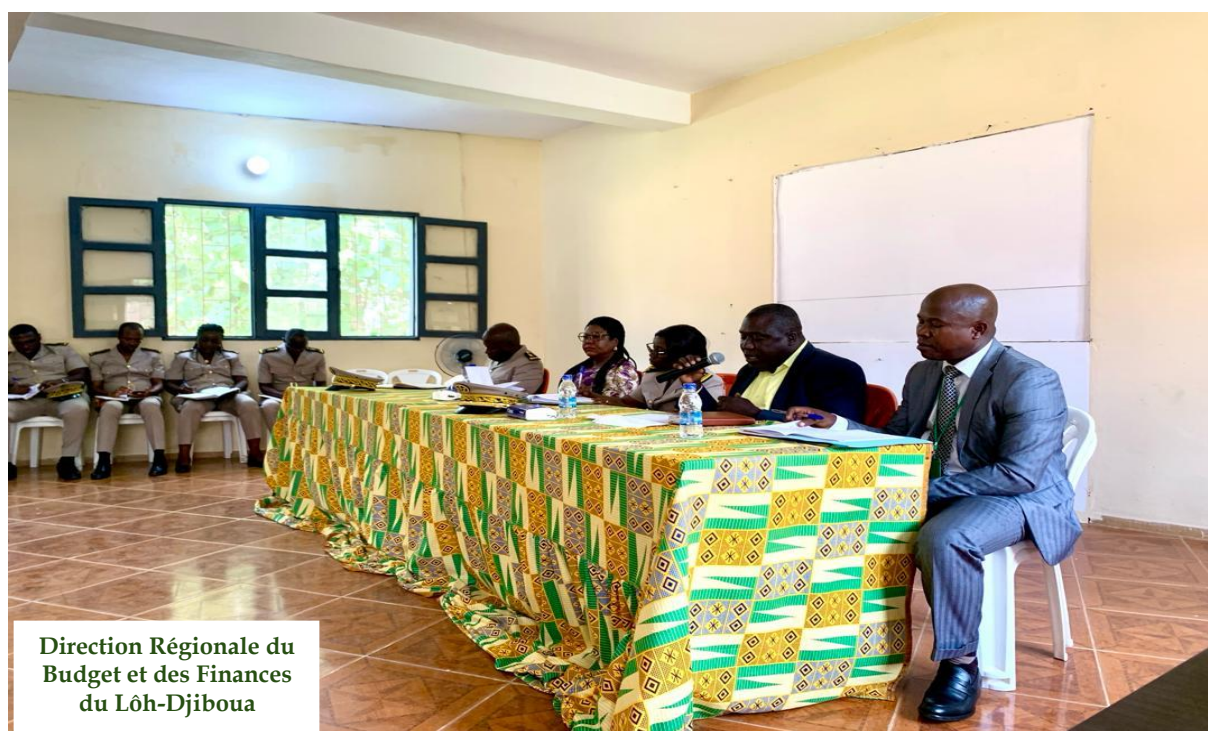
Rentrée Budgétaire 2024 à GUITRY présidée par Madame le préfet de GUITRY.