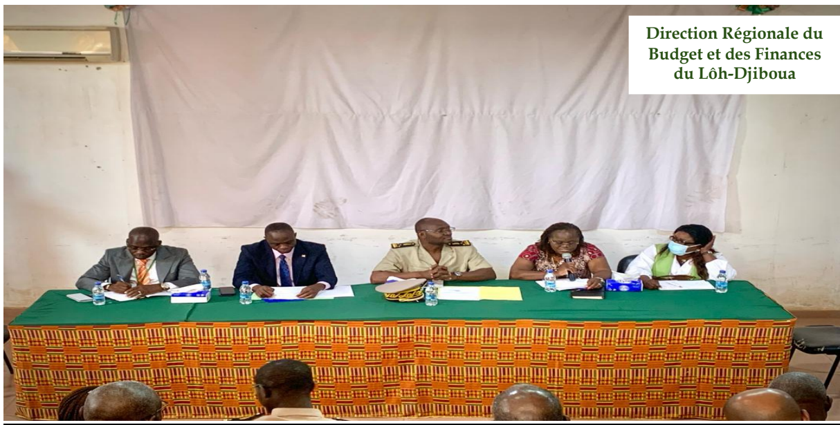
Rentrée Budgétaire 2024 à DIVO présidée par Monsieur le préfet de Divo Préfet de Région du Loh-djiboua