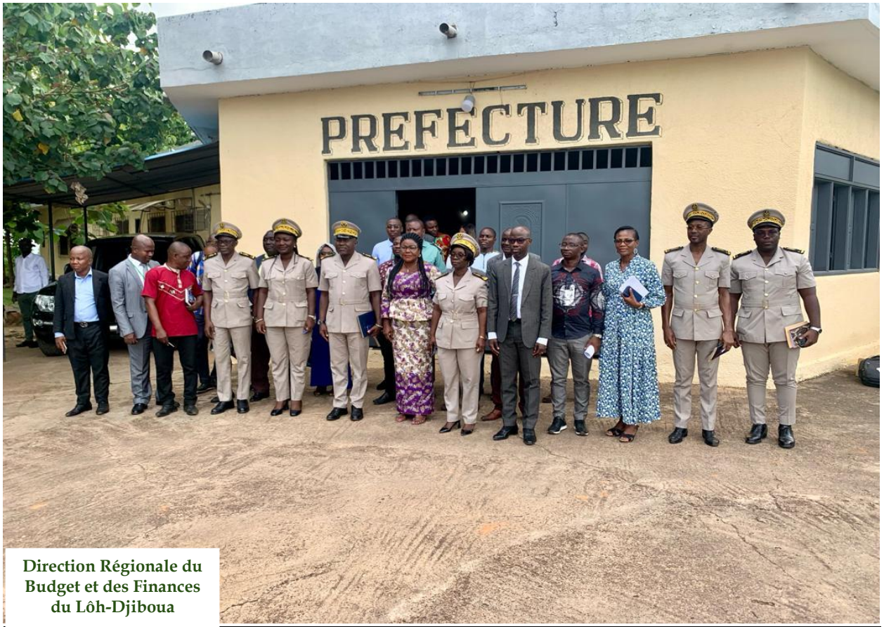
Direction Régionale du Budget et des Finances du Loh-Djiboua

Rentrée Budgétaire 2024 à GUITRY Photo de famille.