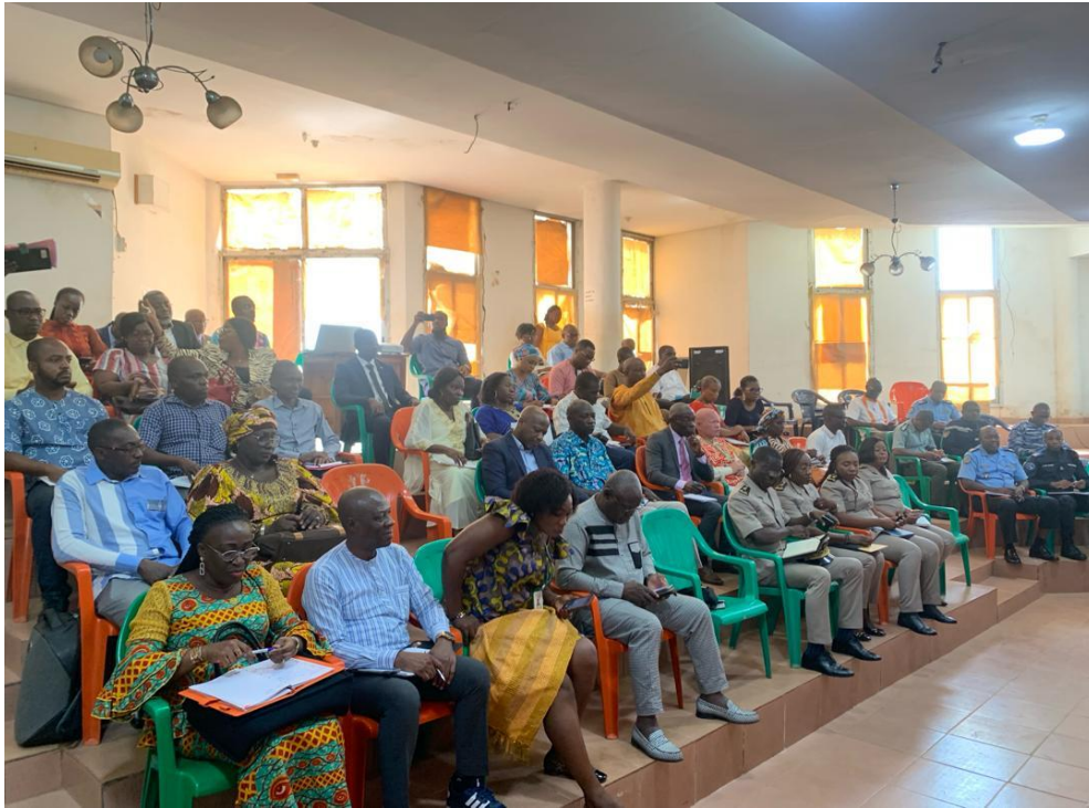
Rentrée Budgétaire 2024 à DIVO Salle de réunion de la préfecture de Région du Lôh-djiboua

Direction Régionale du Budget et des Finances du Lôh-Djiboua